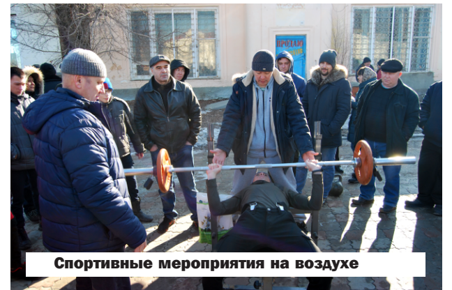
Спортивные мероприятия на воздухе

Интенсивность силовых упражнений может запустить ряд благоприятных изменений в организме тренирую-