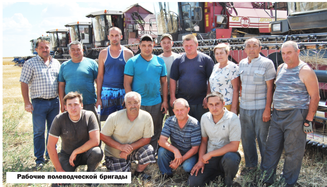
Рабочие полеводческой бригады

Страда идет, каждый благоприятный час используется с полной отдачей. Хочется пожелать труженикам хорошей погоды и доброго урожая!