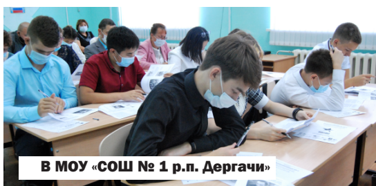
В МОУ «СОШ № 1 р.п. Дергачи»

На территории Саратовской области были открыты более 80 площадок для проведения «Диктанта Победы». Они работали почти во всех муниципальных районах.