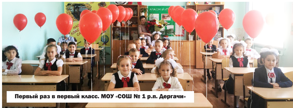
Первый раз в первый класс. МОУ «СОШ № 1 р.п. Дергачи»