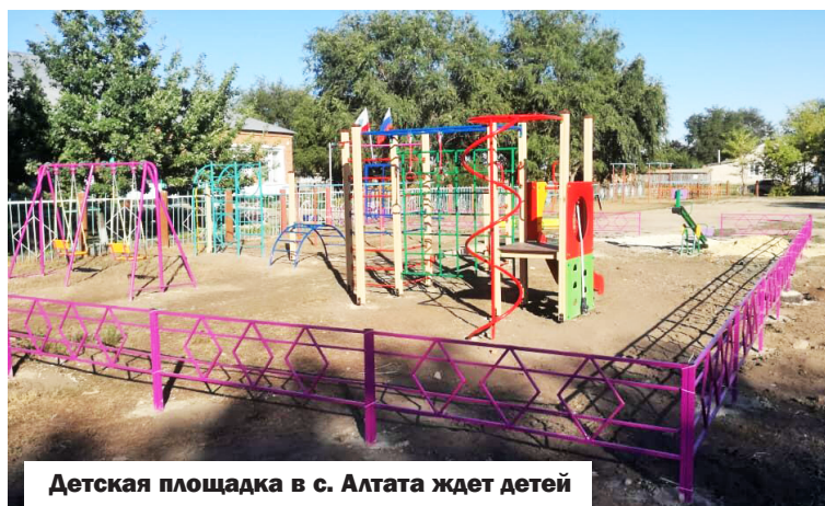
Детская площадка в с. Алтата ждет детей

♦ В текущем году в районе благодаря участию жителей в областной программе «Поддержка проектов, основанных на местных инициативах», установлена детская игровая площадка в с.Алтата.